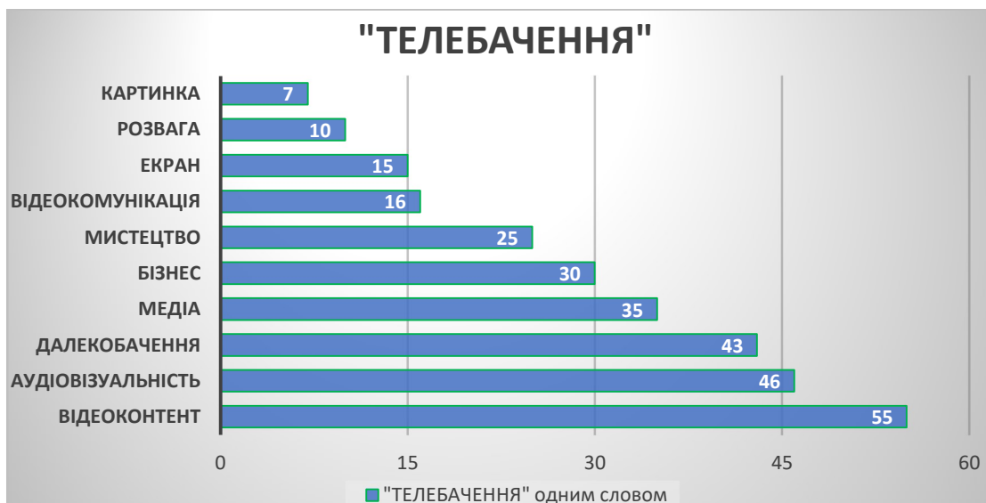
Рис. 2. Рейтинг асоціативних відповідників до терміна «телебачення» від аудиторії дослідження (2022 р.)

Наступні запитання були пов'язані з асоціативним розумінням термінів «телебачення» і «радіомовлення», а саме: студентам запропоновано знайти для цих термінів власний відповідник «одним словом». Зібрані дані, які в статті подані як top-10, стали додатковою ілюстрацією авторських висновків. Найбільше голосів із 352 опитаних отримали аудіовідеоваріанти відповідника «контент» (55 голосів для «телебачення» і 72 – для «радіомовлення»). Високі «рейтинги» отримали й відповідники, які вказують на функціональні особливості телерадіомовлення – «аудіовізуальність», «далекобачення», «звук» та «голос».