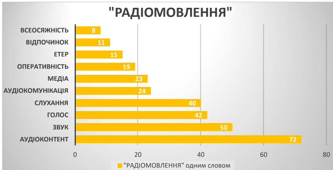
Рис. 3. Рейтинг асоціативних відповідників до терміна «радіомовлення» від аудиторії дослідження (2022 р.)

вищих позначках рейтингу, що також сприймається очікувано. Зрештою, маємо також відповідники для трьох основних функцій телерадіомовлення: інформувати – «контент», пізнавати – «комунікація», розважати – «відпочинок».