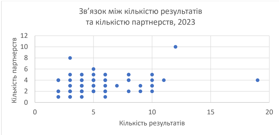
Рис. 4. Зв'язок між кількістю результатів та кількістю партнерств, 2023 р.

партнерств. Саме партнерства є ознакою визнання ефективності внеску редакції у вирішення наболілої проблеми іншими організаціями, бізнесами та владою.