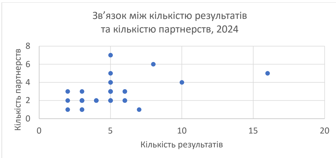
Рис. 6. Зв'язок між кількістю результатів та кількістю партнерств, 2024 р.