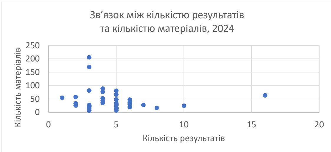
Рис. 5. Зв'язок між кількістю результатів та кількістю матеріалів, 2024 р.

Аналіз звітів за результатами 47 проєктів, виконаних редакціями у 2024 р., дав подібні коефіцієнти кореляції, що дає підстави говорити про повторюваність отриманих висновків (рис. 5 та 6).