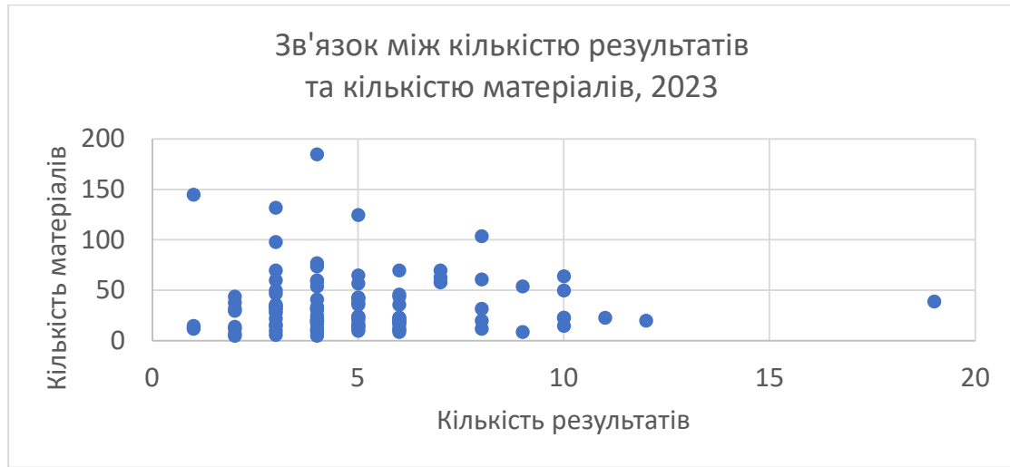
Рис. 3. Зв'язок між кількістю результатів та кількістю матеріалів, 2023 р.

Для аналізу були взяті повні дані з усіх 99 звітів, поданих редакціями за результатами виконаних у 2023 р. проектів (рис. 3). По горизонтальній вісі «Кількість результатів» тут відкладені результати всіх 99 проектів, які подали у своїх звітах редакції місцевих медіа. А по вертикальній вісі до кожної «кількості результатів» поставлена у відповідність «кількість матеріалів», які вони підготували та поширили у зв'язку з виконанням завдань свого проекту.