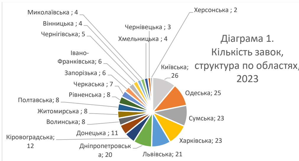
Рис. 1. Розподіл поданих редакціями у 2023 р. заявок по областях (географія поданих заявок)

Базою емпіричної інформації для цього етапу дослідження є дані, отримані в період з грудня 2022 по січень 2024 р. За цей час на конкурси, організовані Українською асоціацією медіабізнесу (УАМБ) було подано 234 заявки, з яких до реалізації й виконання було затверджено 99 проєктів місцевих медіа. Розподіл по регіонах поданих заявок та окремо розподіл проєктів, які виконували редакції, наведено на рис. 1 та 2.