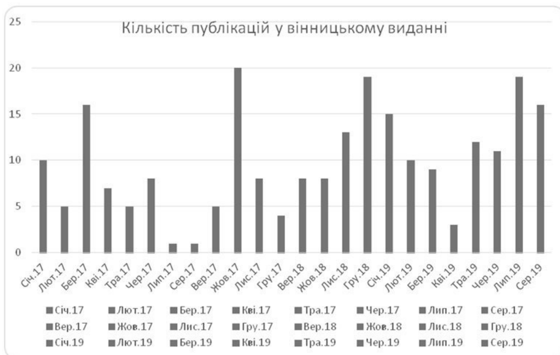
Рис. 3. Кількість публікацій у вінницькому виданні «Вінниця.info»

У вінницькому онлайн-виданні «Вінниця.info» на тему реформи вийшло 233 матеріали: 90 – у 2017 р. та 143 – у 2018–2019 рр.