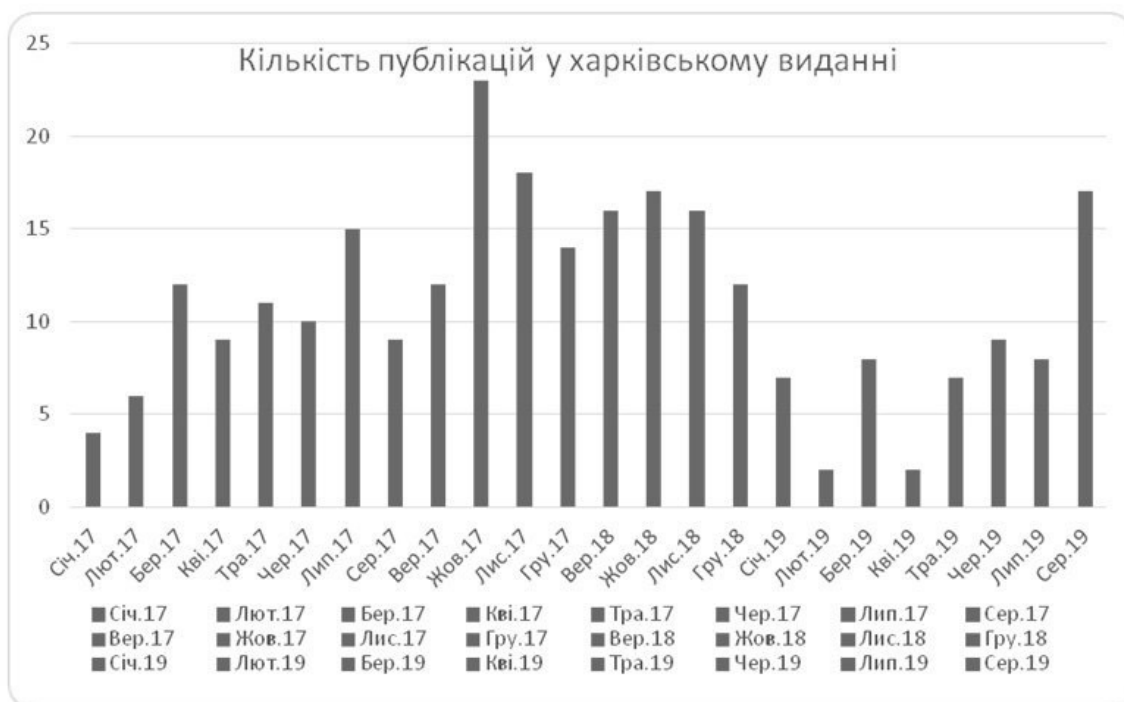
Рис. 2. Кількість публікацій у харківському виданні «Справжня вартя»

В аналізованому харківському виданні «Справжня вартя» опубліковано 267 матеріалів: 146 – у 2017 р. та 121 – у 2018–2019 рр. (рис. 2).