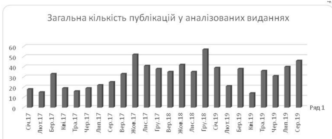
Рис. 6. Загальна кількість публікацій у аналізованих виданнях

Перший пік публікації матеріалів на тему реформи місцевого самоврядування та децентралізації влади припадає на жовтень-грудень 2017 р. (рис. 6).