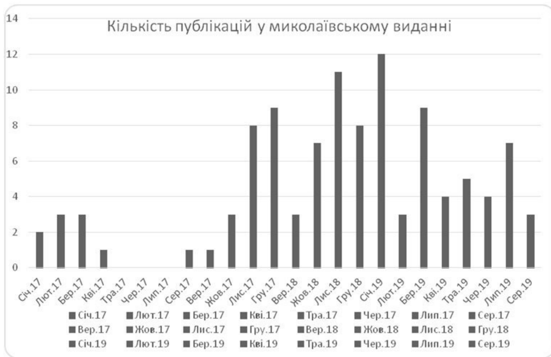
Рис. 4. Кількість публікацій у миколаївському виданні «Ник.Вести»

Отже, найбільше матеріалів про реформу місцевого самоврядування та децентралізацію влади опубліковано в харківському онлайн-виданні «Справжня варта» – 267 (146 у 2017 р. та 121 у 2018–2019 рр.), а найменше в миколаївському онлайн-виданні «Ник.Вести» – 107 (31 – у 2017 р. та 76 – у 2018–2019 рр.).