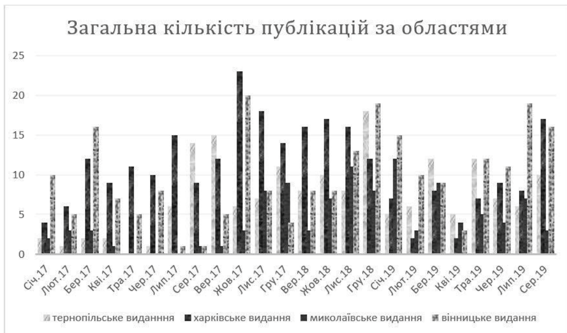
Рис. 5. Кількість публікацій у аналізованих виданнях за областями

Пошук публікацій полегшували теги, під якими їх розміщували. Для «20 хвилин» – це «ОТГ», «територіальна громада». Харківське видання «Справжня варта» під матеріалами розміщувало теги «громада» та «децентралізація». Вінницьке онлайн-видання «Вінниця.info» використовувало тег «громада», як і харківське «Справжня варта». Миколаївське видання «Ник.Вести» маркувало публікації такого типу з тегом «ОТГ». Зауважимо, тег «децентралізація», «місцеве самоврядування» в аналізованих виданнях трапляється не часто, зазвичай публікації про реформу мають спільні теги «ОТГ», «громада».