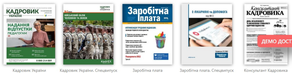
Рис. 1. Офіційна сторінка сайту компанії «Kadroland.com»

Серед таких видань «Кадровик України» – професійне видання для кадровиків, юристів, менеджерів з персоналу й інших фахівців HR-служб; виходить щомісяця обсягом 96 сторінок, де глибоко та всебічно розглядаються всі «кадрові» питання: трудове право, кадровий облік, судова практика, діловодство, соціальне страхування та багато іншого. «Заробітна плата» – це професійний щомісячник у 96 сторінок інформації, необхідної для фахівців підприємств усіх форм власності, які займаються розрахунком, обліком та оподаткуванням оплати праці.